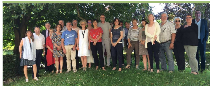
Le comité de section de l'Essonne 2018-2020

L'instance départementale, le comité de section, se réunit 3 à 4 fois par an pour échanger sur les projets régionaux et nationaux de la MGEN et mettre en œuvre des actions locales destinées aux adhérents (actions de prévention santé, aide sociale, ...).